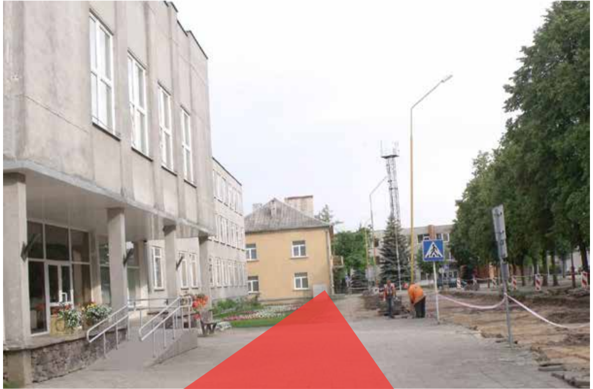
Ardoma senoji gatvės bei šaligatvio danga.